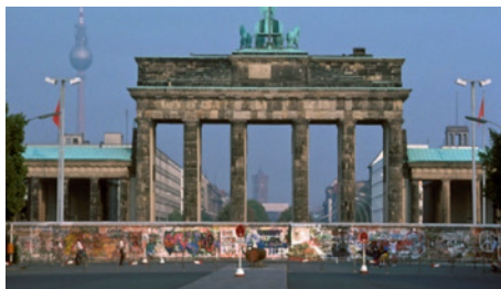
Die Berliner-Mauer im September 1988