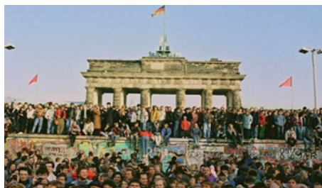
Die Berliner-Mauer im November 1989